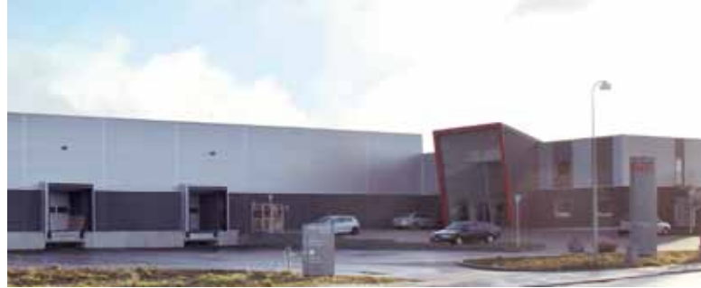
Roth Nordic logistikcenter, Frederikssund.

Vores motto "...living full of energy" betyder at vi i tanke og handling fokuserer på miljøet, individet og udnyttelse af alternative energikilder. Vores produk-