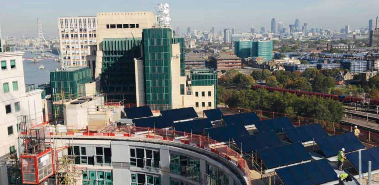
Roth solvarmesystem til South Bank, London.