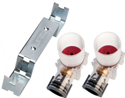
Roth QuickBox®-red til mur, dobbelt, 15 mm VVS-nr. 087274.015