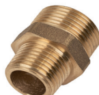
Roth overgang 3/4" EURO-red x 1/2" nippel Anvendes sammen med Roth fordelerkoblinger. VVS-nr. 045694.136