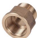
Roth overgang 3/4" EURO-red x 3/4" muffe Anvendes sammen med Roth fordelerkoblinger. VVS-nr. 045694.046