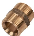
Roth brystnippel 3/4" EURO-red x 3/4" EURO-red Anvendes sammen med Roth fordelerkoblinger. VVS-nr. 045694.206