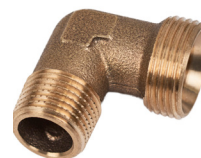
Roth vinkel 3/4" EURO-red x 1/2" nippel Anvendes sammen med Roth fordelerkoblinger. VVS-nr. 045694.333