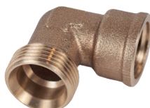
Roth vinkel 3/4" EURO-red x 1/2" muffe Anvendes sammen med Roth fordelerkoblinger. VVS-nr. 045694.433