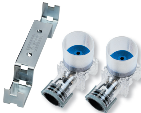
Roth QuickBox® - 316, 18 mm x 3/4", dobbelt VVS-nr. 087274.378