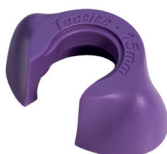
Roth demonteringsværktøj 15 mm til QuickBox®-red VVS-nr. 047198.115