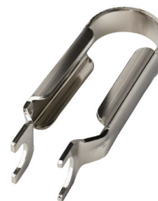
Roth demonteringsværktøj 15 mm - VVS-nr. 047198.015 18 mm - VVS-nr. 047198.018 22 mm - VVS-nr. 047198.022 28 mm - VVS-nr. 047198.028