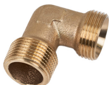
Roth vinkel 3/4" EURO-red x 3/4" nippel Anvendes sammen med Roth fordelerkoblinger. VVS-nr. 045694.406