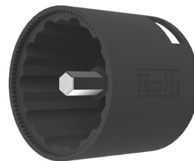
Roth QuickBox® værktøj til flange VVS-nr. 087289.252