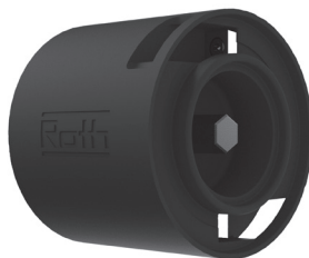
Roth QuickBox® fræserveskrævtøj plast VVS-nr. 087289.251