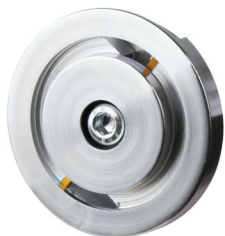
Roth QuickBox® fræseværktøj VVS-nr. 087289.210