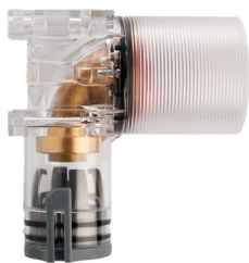
Roth QuickBox®-red til mur, 15 mm VVS-nr. 087274.115