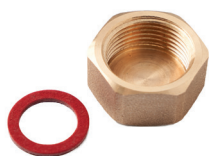
Roth slutmuffe 3/4", red Anvendes til EURO-red fordelerrør VVS-nr. 046615.126