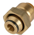
Roth indstikskobling 15 mm x 3/4" EURO-red Leveres med støttebøsning i aisi 316. VVS-nr. 046217.545