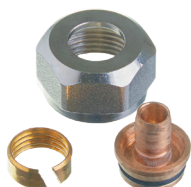
Roth fordelerkobling EURO-red 12 mm x 3/4" EURO-red - VVS-nr. 401975.812 15 mm x 3/4" EURO-red - VVS-nr. 401975.815 16 mm x 3/4" EURO-red - VVS-nr. 401975.816 18 mm x 3/4" EURO-red - VVS-nr. 401975.818 20 mm x 3/4" EURO-red - VVS-nr. 401975.820