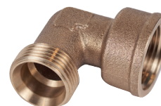
Roth vinkel 3/4" EURO-red x 3/4" muffe Anvendes sammen med Roth fordelerkoblinger. VVS-nr. 045694.436