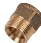
Roth overgang 3/4" EURO-red x 1/2" muffe Anvendes sammen med Roth fordelerkoblinger. VVS-nr. 045694.036