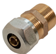
Roth overgang, red 12 mm x 3/4" nippel - VVS-nr. 046211.136 15 mm x 3/4" nippel - VVS-nr. 046211.176 16 mm x 3/4" nippel - VVS-nr. 046211.195 18 mm x 3/4" nippel - VVS-nr. 046211.232 20 mm x 3/4" nippel - VVS-nr. 046211.246