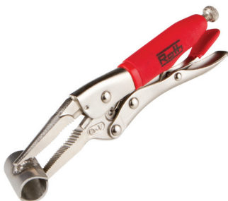
Roth MultiPex® tang VVS-nr. 087289.200