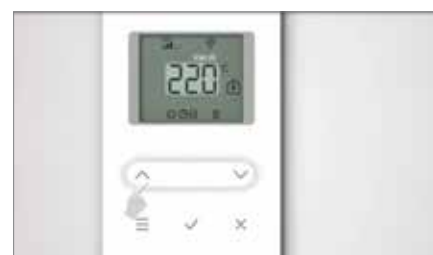
3. Indstil ur og dato. Dette behøver du kun at gøre på én rumtermostat i hele anlægget.