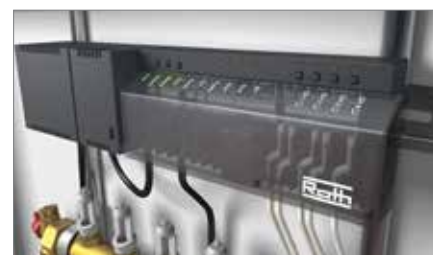
1. Monter kontrolenheden og tilslut termomotorerne.

Med Touchline har vi udviklet et system som har en meget lang levetid. Samtidig er alle plastmaterialer i termostaten 100% genanvendelige. Software opdatering via SD kort fremtidssikrer systemet.