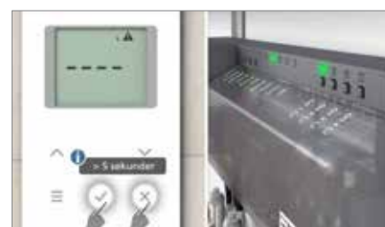
2. En-to-tilmeldt: Vælg kanal på kontrolenheden med ét tryk og tilmeld rumtermostaten med ét tryk, så er du klar.