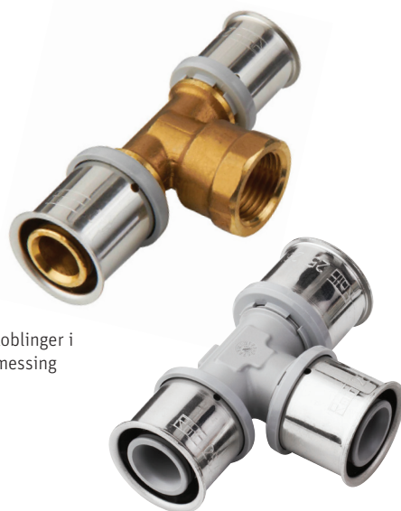
Preskoblinger i DZR messing